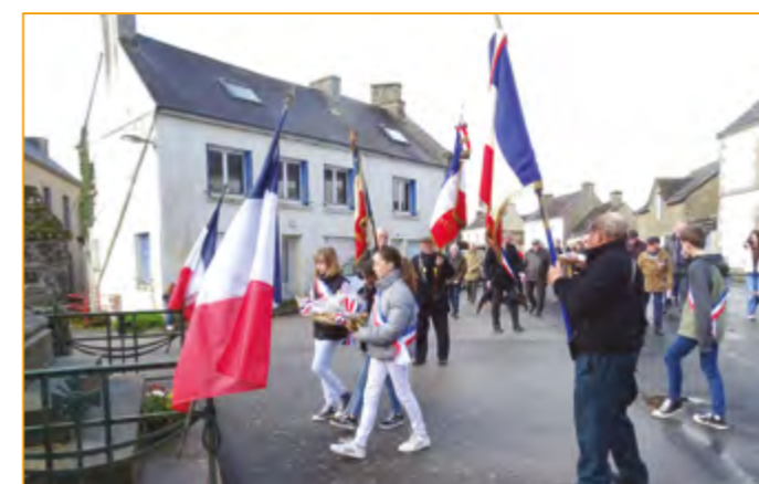
Cérémonie du 19 mars 2023