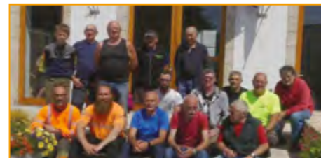
Journée débroussaillage octobre 2023

La Randonnée du Chapelain s'est déroulée avec succès le 22 octobre, avec une participation de 710 randonneurs vététistes et pédestres, qui ont eu le plaisir de traverser les chemins de la commune, dont une partie du GR ; le soleil s'est même invité pour cette journée.