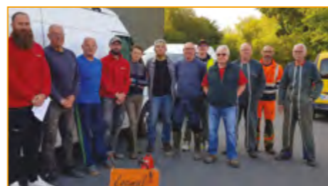
Journée débroussaillage juin 2023

Plusieurs journées de débroussaillage ont été nécessaires en juin et octobre pour nettoyer les chemins (pour rappel, le club fournit l'essence pour le matériel de nettoyage).