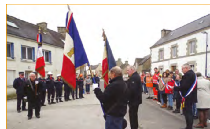
Cérémonie du 11 novembre 2023