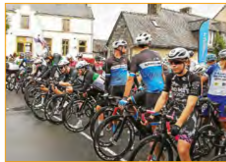
Départ de la course KBE

En septembre et octobre, plusieurs licenciés cyclistes et marcheurs se sont également rendus à différentes randonnées locales comme Guern, Malguénac, Melrand, Le Sourn... Et ont participé à la Gourinoise le 15/10.