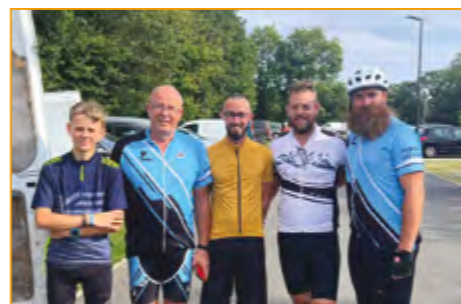
Sortie Rando VTT à Malguénac

En septembre et octobre, plusieurs licenciés cyclistes et marcheurs se sont également rendus à différentes randonnées locales comme Guern, Malguénac, Melrand, Le Sourn... Et ont participé à la Gourinoise le 15/10.