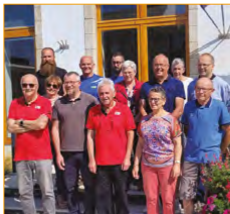
Réunion préparatoire organisation de la KBE

Le 30 juillet, le départ de l'étape n° 3 de la course KBE Kreizh Breizh Elites était donné à Locmalo, arrivée à Carhaix (183.6 km), les bénévoles ont participé à la bonne organisation et l'accueil des équipes et des véhicules d'assistance des coureurs ; Le KBE est une course cycliste inscrite au calendrier européen de l'Union Cycliste Internationale. Il se déroule tous les ans fin juillet sur les routes du Centre Bretagne. Avec plus de 150 coureurs de plus de 24 nationalités différentes au départ, le KBE se déroule durant 3 jours et comprend 4 étapes.