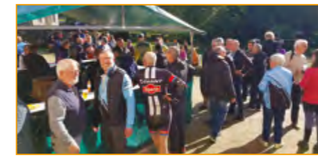
Randonnée du Chapelain

Le club remercie ainsi tous les bénévoles qui ont participé et aidé au débroussaillage, à l'organisation de la KBE et de la rando annuelle.